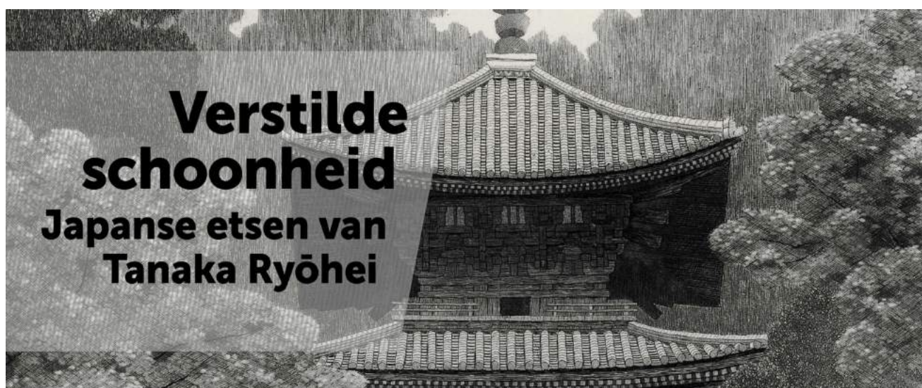
Tentoonstelling 1: "Verstilde schoonheid. Japanse etsen van Tanaka Ryōhei"

Naast de vaste tentoonstelling op de begane grond over Siebold zijn er drie tentoonstellingen en een presentatie geweest in de tijdelijke tentoonstellingsruimtes op de eerste en tweede verdieping. De selectie 'Siebold'-kaarten in de vitrine in de Panoramakamer wordt jaarlijks gewijzigd. Ook in 2020 is dit gebeurd. Daarnaast is de vaste opstelling volledig herzien met 'nieuwe' objecten. Er is een compleet andere inrichting die zo goed mogelijk is uitgelicht binnen de mogelijkheden van het museum en alle objecten zijn beschreven in drie talen; Nederlands, Engels en Japans.