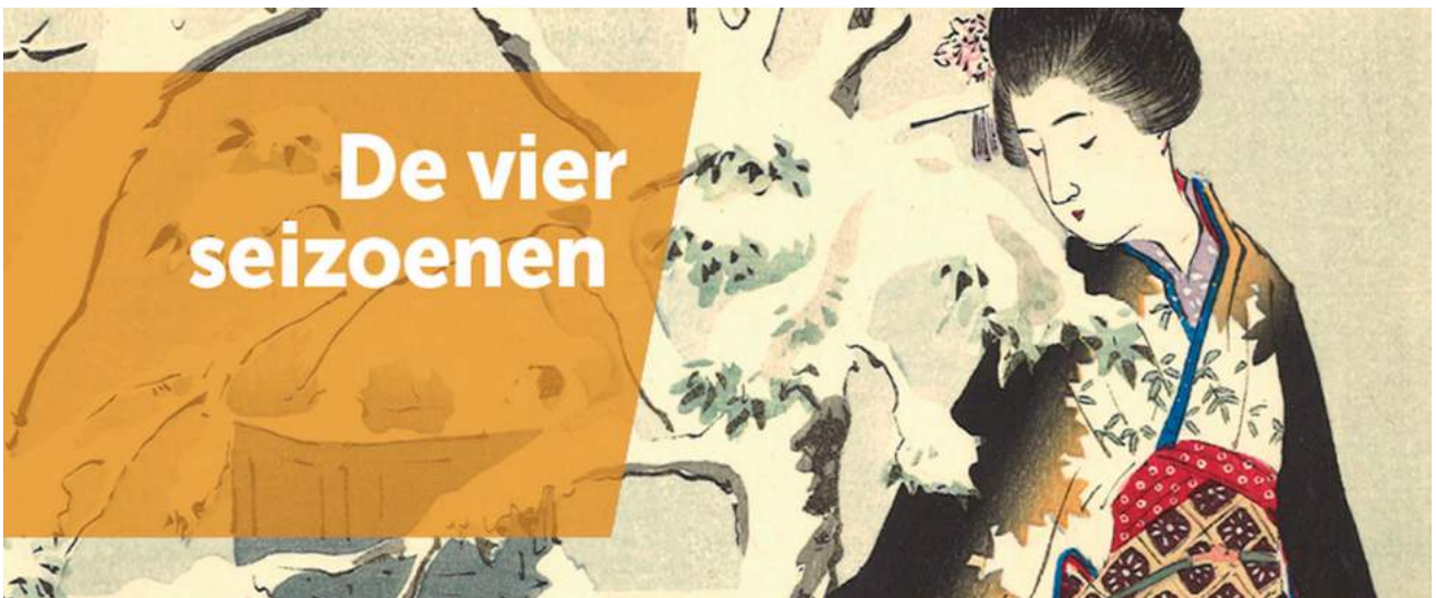
Expositie 2: “Vier seizoenen. Prenten uit schenking Muck en Mieke Douma”

Van 20 september t/m 19 januari 2020, in de tijdelijke tentoonstellingsruimtes, 1 e en 2 e verdieping. Bezoekersaantal in deze periode: 18.028 bezoekers.